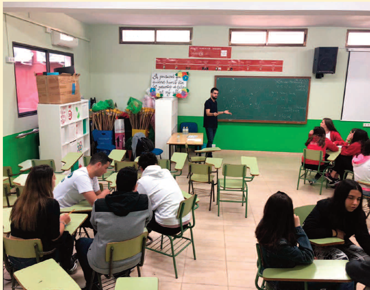
Colegio CEI de Murcia

Fundación Barquín Hermoso. Cuenta con unos 590 alumnos de edades comprendidas entre 3 y 16 años. El trabajo cooperativo y por proyectos, así como las rutinas de pensamiento son metodologías esenciales en el colegio para dar respuesta a la diversidad del alumnado desde un enfoque inclusivo.