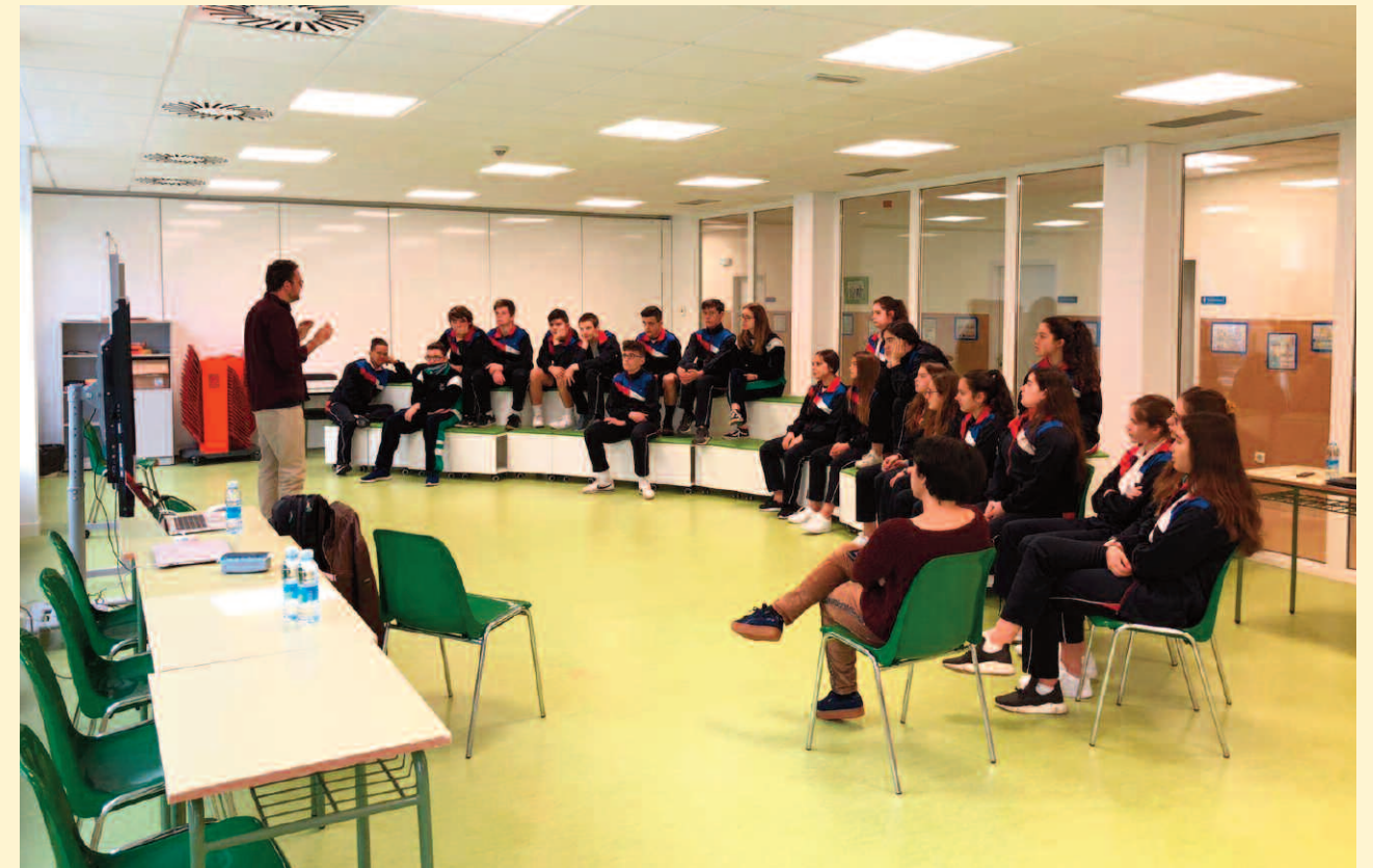
Colegio Menéndez Pelayo de Castro Urdiales, Cantabria

Durante el mes de abril un total de 81 alumnos y alumnas de las tres provincias han participado en los talleres de la primera fase de formación impartidos por Guzmán