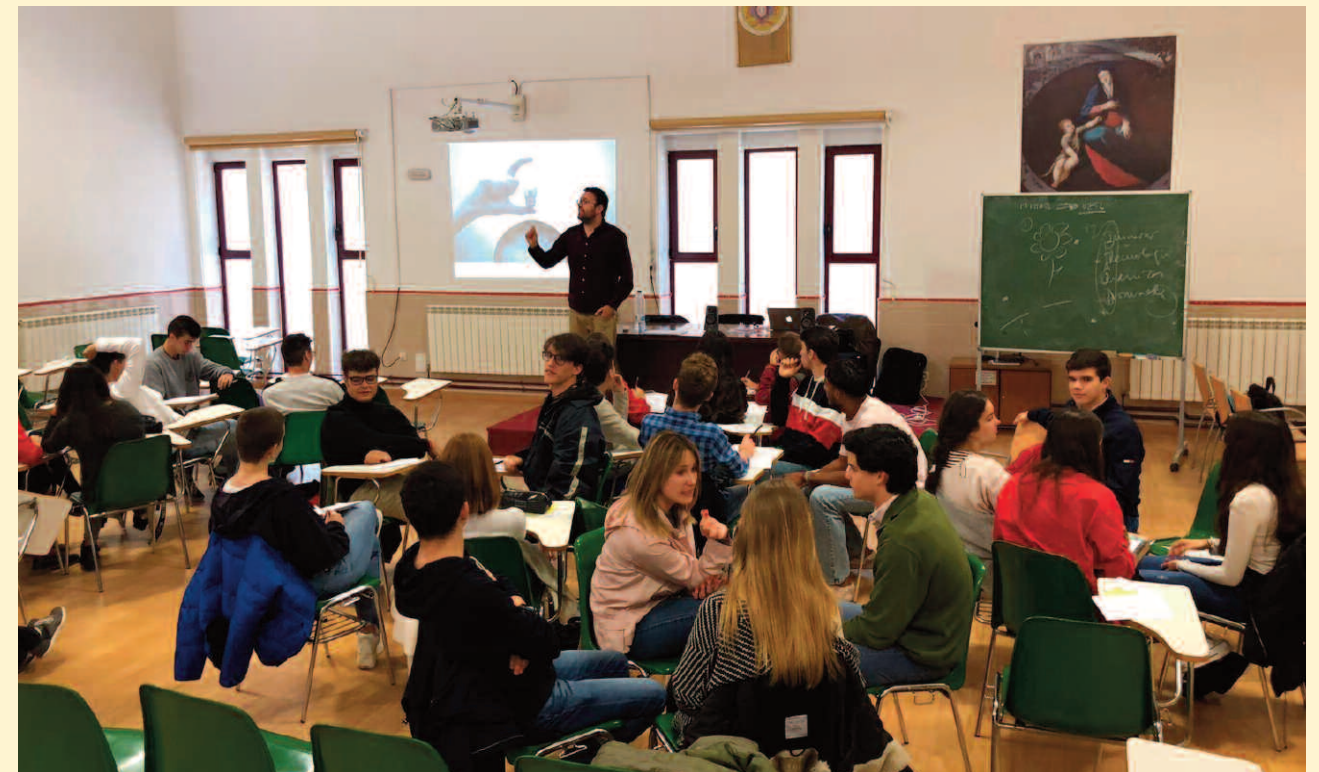
Colegio Nuestra Señora de los Infantes de Toledo, Castilla La Mancha