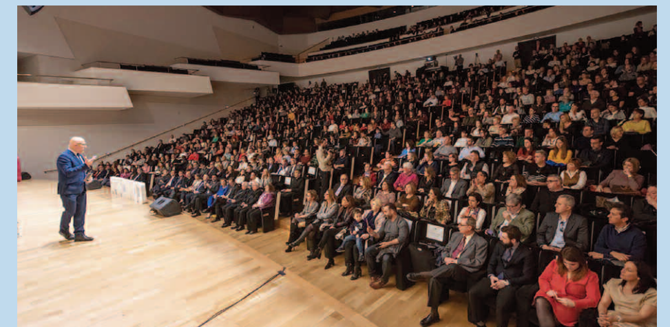
Vista panorámica de los asistentes al acto.